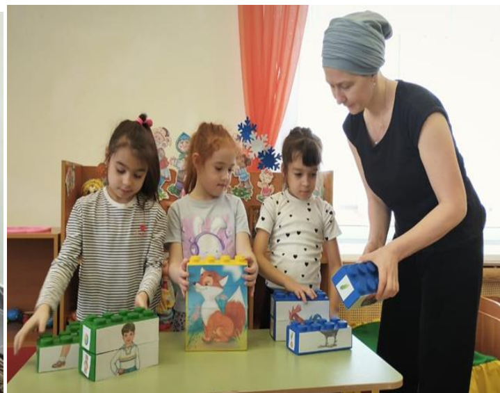
Шакмактагы рәсемнәр ярдәмендә сүз, сүзтезмә өйрәнәбез.